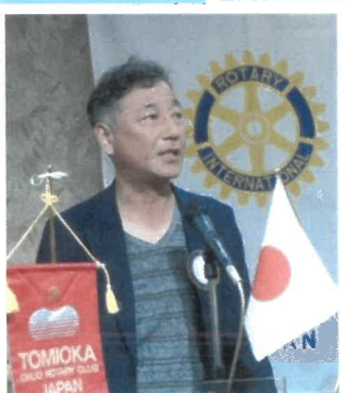
ニコニコ 山崎委員長 30周年なので今まで以上によろしくお願いします。