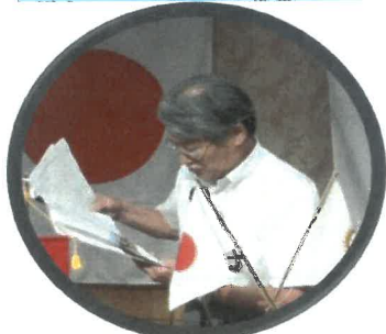
ロータリーの友の読みどころ 岡田君 「決議 23-34」ぜひ読んでください。