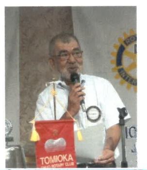
社会奉仕 松本委員長 地域社会と連携、地域社会活動に参加します。